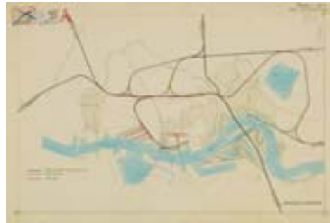
16 Spoorwegplan A. Plate, 1909 17 Spoorwegplan W.F.H. van Rijkevorsel, 1912