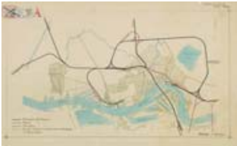
15 Plattegrond van Rotterdam met de ontworpen uitbreidingsplannen, 1903